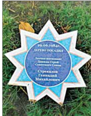
Памятные места города Сочи.

ми возможностями. С этой целью были модернизированы все основные элементы городской инфраструктуры, начиная от улиц и транспорта и заканчивая гостиницами, учреждениями и спортивными объектами. В результате, люди с ограниченными возможностями со всей России могут эффективно реализовать своё право на отдых. Но, ещё важнее, что сочинская инновация распространяется по всей России и практически все города страны работают в этом направлении.